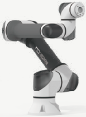
협동로봇 RB시리즈 표준모델 | 최초 공압/신호라인 내장형 모델