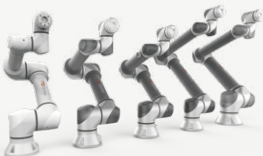
※ 컬러선택가능(기본 or All White)